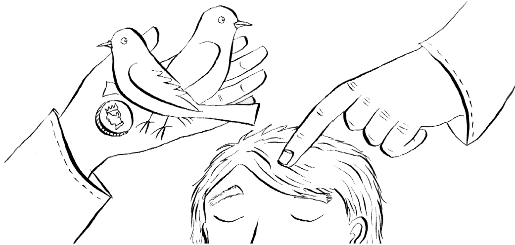
Mae hyd yn oed y gwallt ar dy ben wedi eu cyfrif.

Mae Iesu yn ein hatgoffa bod angen inni sefyll i fyny a siarad dros ein ffydd, hyd yn oed pan fydd yn gostus i ni.