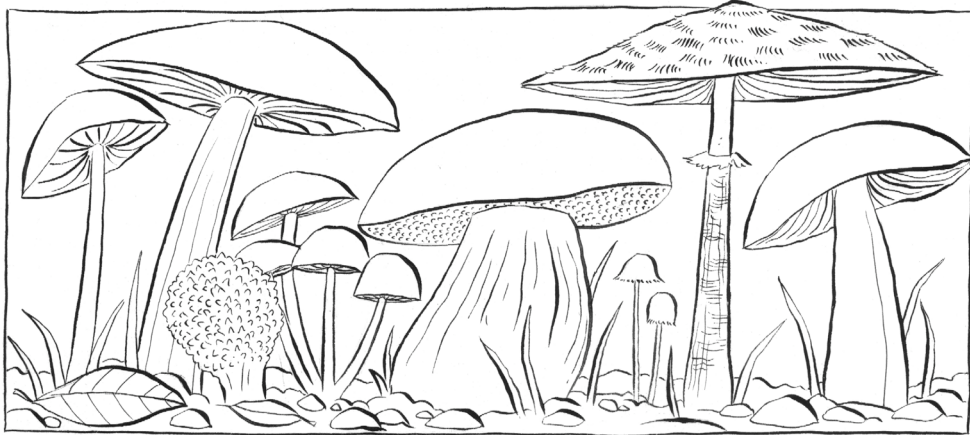
Mae madarch yn tyfu yn y tywyllwch. Gallwn dyfu gyda Duw, hyd yn oed pan fo amseroedd yn anodd.

Mae Duw gyda ni, a bydd yn rhoi pethau da i ni pan fyddwn yn wynebu cyfnodau anodd.